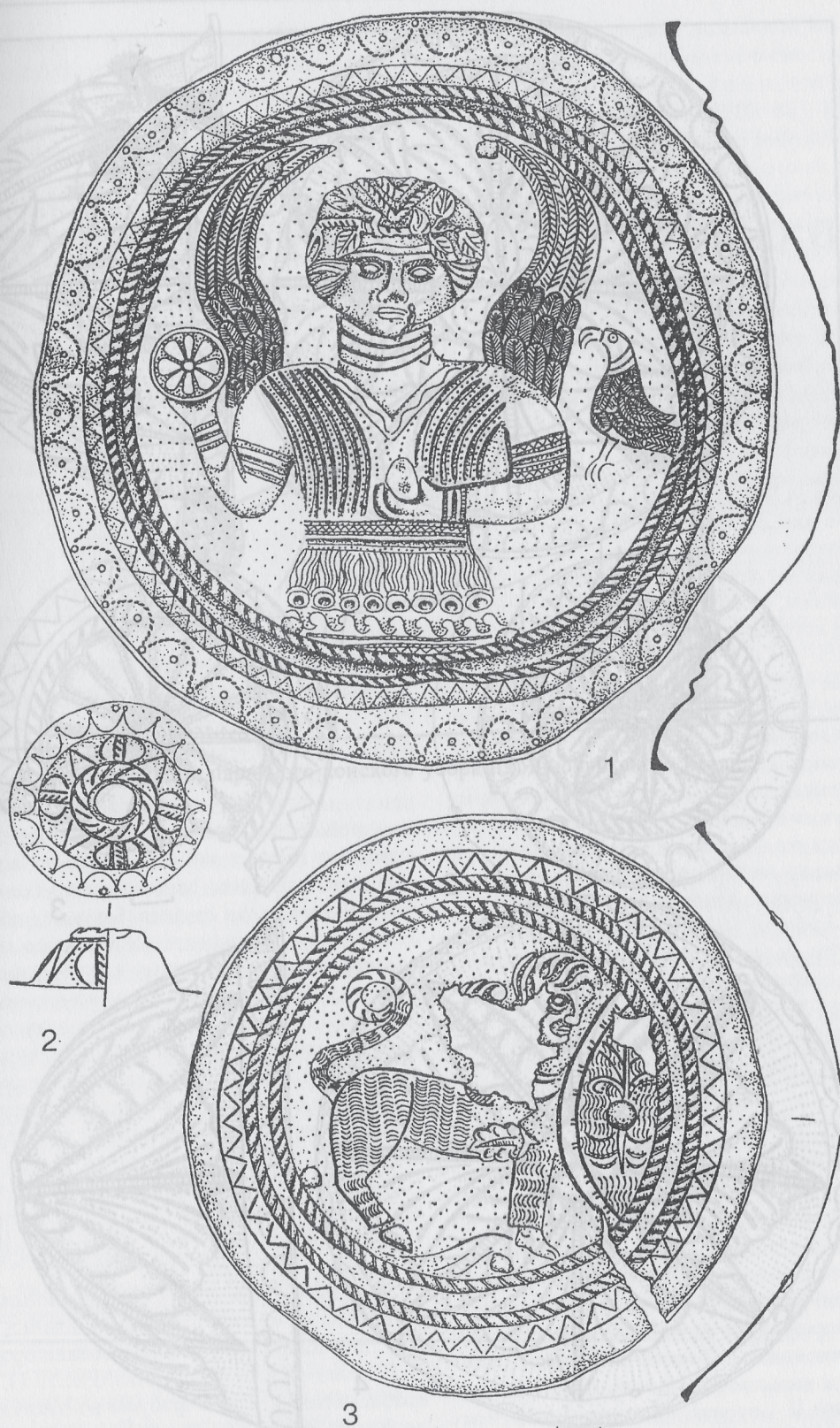
Рис.1. 1 - нагрудный фалар; 2 - бляшка для крепления султанчика; 3 - налобная бляха.