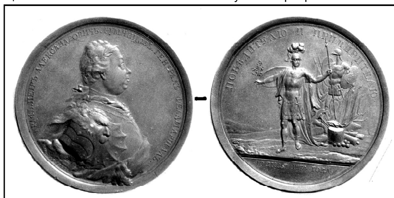
Рис. 2. Памятная медаль в честь фельдмаршала П.А. Румянцева.

8 медалей в нумизматической коллекции музея посвящены русско-турецкой войне 1787-1791 гг. (Фонды НМИМ FB – 4484, 4486, 4493, 7452, 7455, 7458, 7460, 7461). За взятие сильнейшей турецкой крепости Измаил в 1790 г. все низшие чины получили серебряные овалы