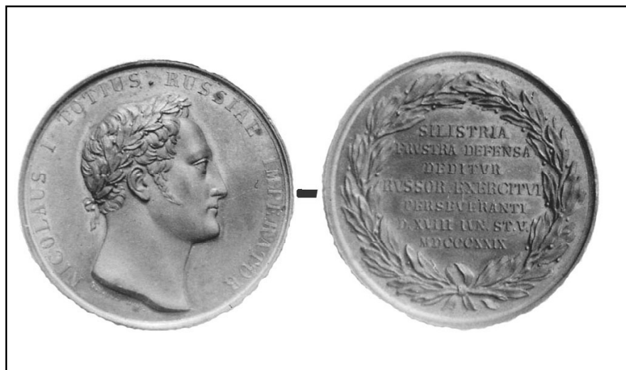
Рис. 5. Медаль «На взятие Силистрии». 1829 г.

Другая памятная медная медаль «Варна – победоносным Российским воинством взята сентября 29 дня 1828 года» с изображением