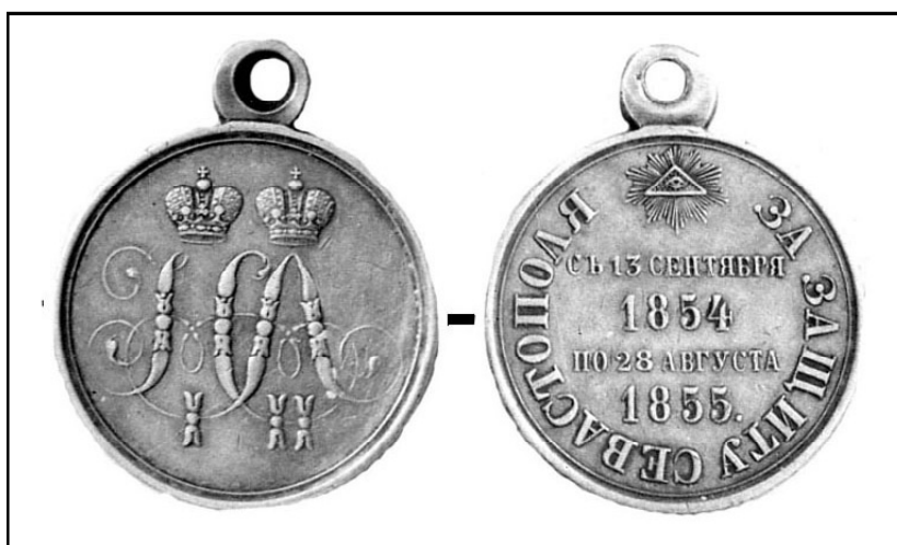
Рис. 6. Наградная серебряная медаль «За защиту Севастополя».

портрета Николая I, надписью «НИКОЛАЙ I ИМПЕРАТОРЪ ВСЕРОССИЙСКІЙ» и с изображением лаврового венка с легендой.