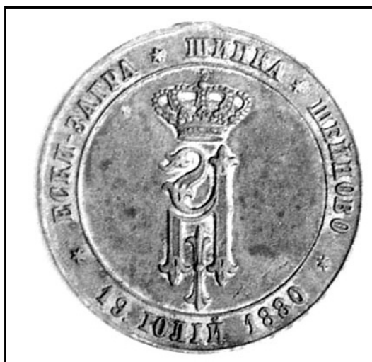
Рис. 8. Болгарская медаль в честь освобождения Балкан (лицевая сторона).

В память освобождения Балкан от турецкого ига были учреждены также болгарские, сербские, черногорские и румынские награды. Музей располагает одной болгарской медалью (рис. 8) и румынским крестом 1877-1878 гг. На лицевой стороне медали изображен вензель Александра II под императорской короной, а по окружности – названия освобожденных городов: Шипка, Шейново, Ески Загра, дата – 19 июля 1880. На оборотной стороне надпись на болгарском языке: «На ополченцитѣ за ос-