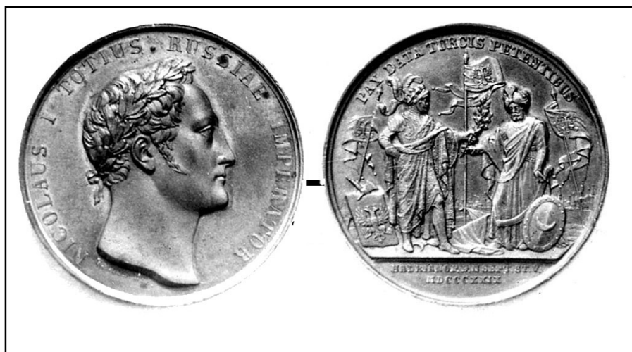
Рис. 4. Медаль «На Адрианопольский мир», 1829 г.

деятелей и исторических событий (Косарева 1982: 49).