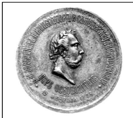
Рис. 7. Бронзовая медаль «В память освобождения болгар» (лицевая сторона).

За участие в русско-турецкой войне 1877-1878 гг., в ходе которой было окончательно подорвано турецкое господство на Балканах, была учреждена русская наградная медаль в трех разновидностях металла. Серебряную медаль получили все участники героической обороны Шипки, Баязета, а также штурма турецкой крепости Карс. Учреждена она была 17 апреля 1878 г. Светло-бронзовой медалью были отмечены воины, участвовавшие в прочих сражениях, и, наконец, темно-бронзовые медали получили лица, находившиеся по делам службы в зоне военных действий, но непосредственного участия в боях не принимавшие.