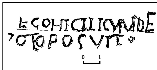
Рис. 3. Прорисовка надписи с рельефа.

--- ET COH(ortis) I CILICVM DE/ [CIANAЕ] -----[EX] VOTO POSVIT