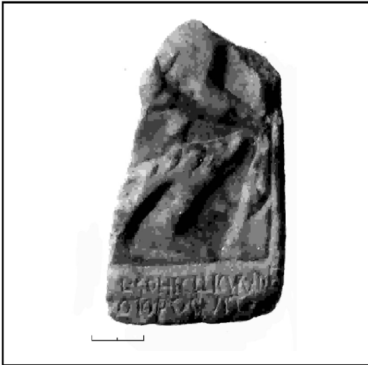
Рис. 1. Обломок мраморного рельефа с фрагментированной латинской надписью из раскопок Ольвии.

резчиком. Об этом свидетельствует также разное расстояние между буквами и небрежный шрифт, который по своему характеру достаточно близок «вульгарному» стилю поздних латинских эпиграфических памятников (ср.: Sandys 1969: 51-52). Высота букв 0,5-0,9 см. Из особенностей шрифта следует отметить, что цифра I, буквы I, L и V имеют апексы, а буква D в конце первой строки значительно меньше следующей за ней E. Буквы V и M вырезаны очень небрежно и даны в лигатуре (рис. 3).