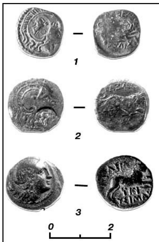
Рис. 3. Бронзовые монеты Лисимаха: с контрмарками (1; 2) и городской (?) монограммой Одесса (3).

Не исключено, что Спаратеса получил определенные полномочия во Фракии от самого Лисимаха. Возможно, в Северо-Восточной Фракии существовала обособленная военно-административная единица, подобная малоазиатским сатрапиям, которая служила буфером между владениями Лисимаха к югу от Гема и землями гетов и скифов. С помощью расположенных в области военных частей Лисимах держал под постоянным контролем как склонные к бунту греческие города на современном