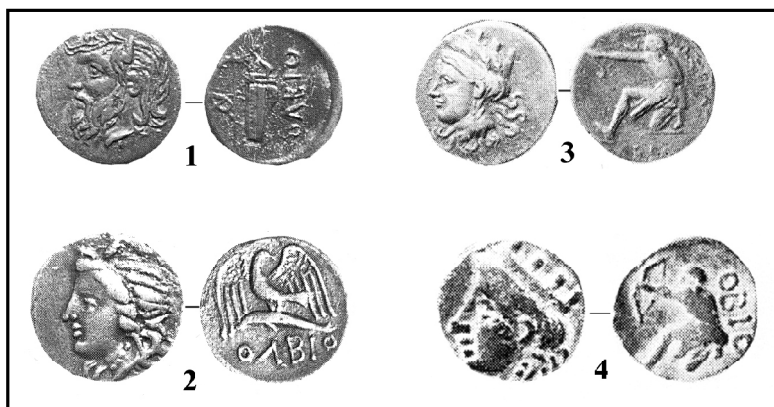
Рис. 3. 1-2 – серебряные монеты Ольвии: подгруппы С и D; 3-4 – медные монеты.

случаем) совпадающие с монограммами на «борисфенах» (рис. 3: 1). Мы полагаем следующую последовательность выпусков внутри подгруппы. Начинается она с выпуска с монограммами ПА и АП, за которыми, очевидно, скрывается один и тот же магистрат. Он же (известен в форме АП) отмечен среди магистратов на «борисфенах» I группы. Выпуск «борисфена» этого магистрата не связан общими штемпелями с монетами I группы других магистратов, что позволяет отнести его к первому выпуску данной серии. Статеры с ПА и АП имели общие штемпеля аверсов, такой же штемпель имеет статер с монограммами ПО и ПО. Мы полагаем, что магистратское имя скрывается за монограммой ПО, которая также представлена среди «борисфенов». Статеры с ПА, АП и ПО имеют черты сближающие их по стилю со статерами предыдущей группы.