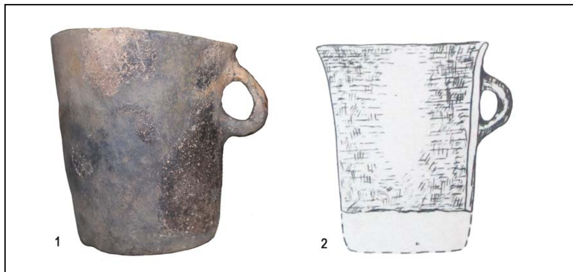
Рис. 2. «Цилиндрические» черпаки Единецкой культуры: 1 — Костешть II (кург. 4, погр. 1); 2 — Костешть VIII (по: Дергачев 1976).