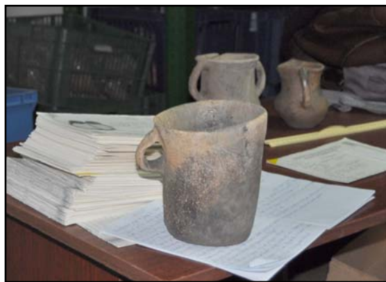
Рис. 1. «Цилиндрический» черпак из Костешть II (нург. 4, погр. 1). Единецкая культура.