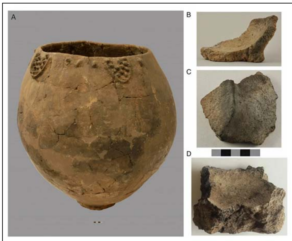
Рис. 1. Ранненеолитическая керамика Шулавери-Шомутепинской культуры. (А) Кувшин из Храмис-Диди-Гора; (В–D) фрагменты оснований кувшинов со следами органических оттисков. (по McGovern et al. 2017).