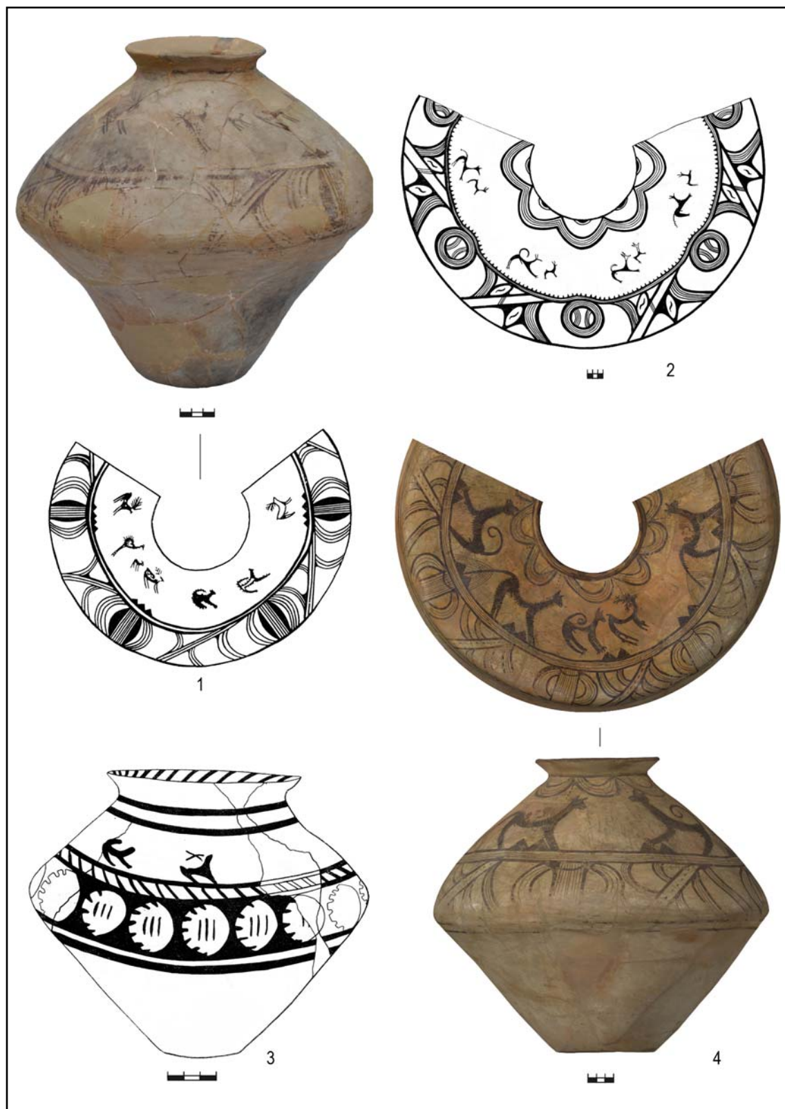
Рис. 5. Сцены охоты на керамике культуры Кукутень В-Триполье С1: 1, 2, 4 — Варваровка VIII; 3 — Поднепровье (1 — рисунок по Маркевич 1981, фото автора; 2 — по Маркевич 1981; 3 — по Черныш 1982; 4—3D изображение Д.А. Топала).