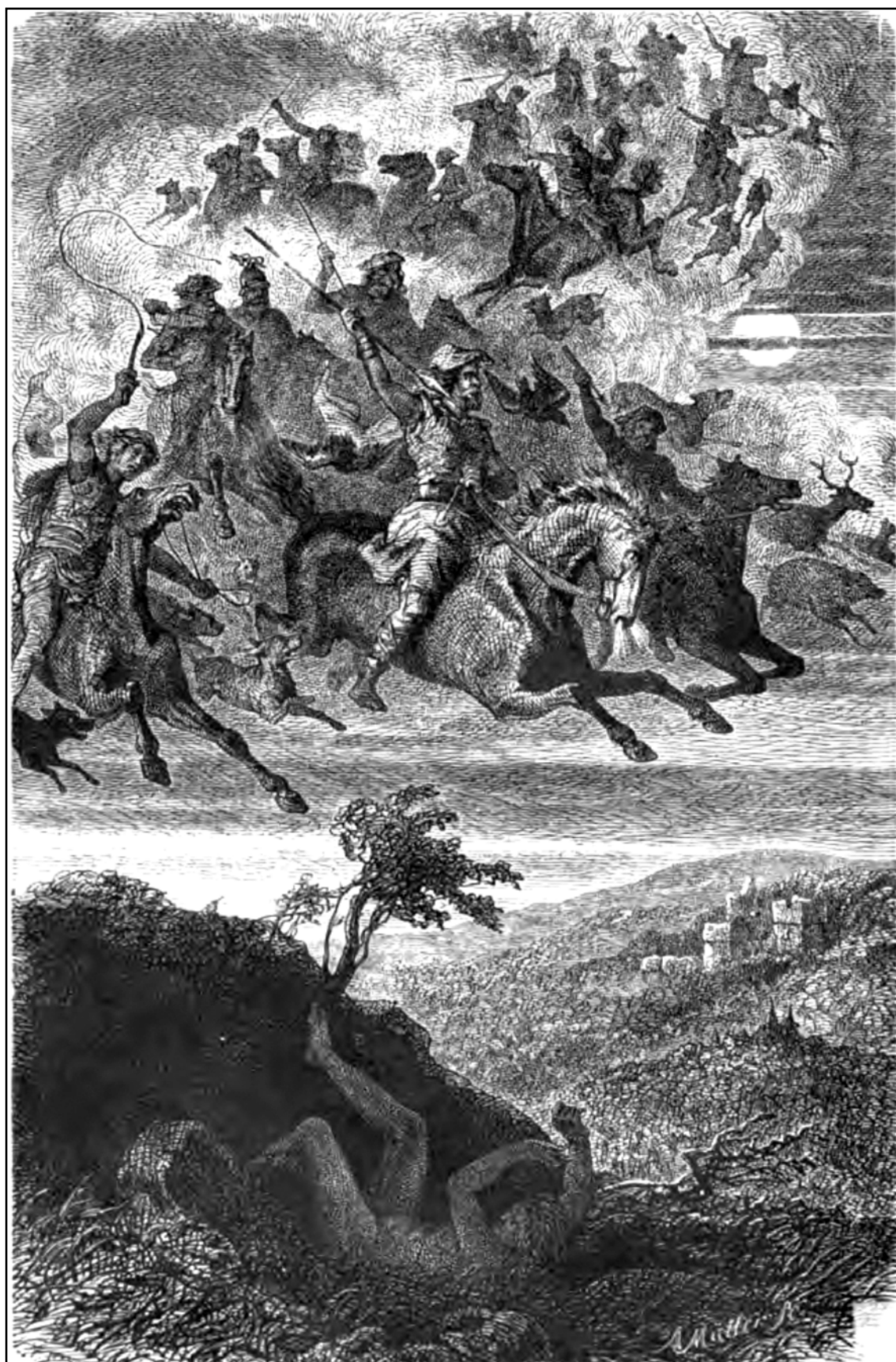
Рис. 1. Фридрих Вильгельм Гейне, «Дикая охота Водана», 1882 г.