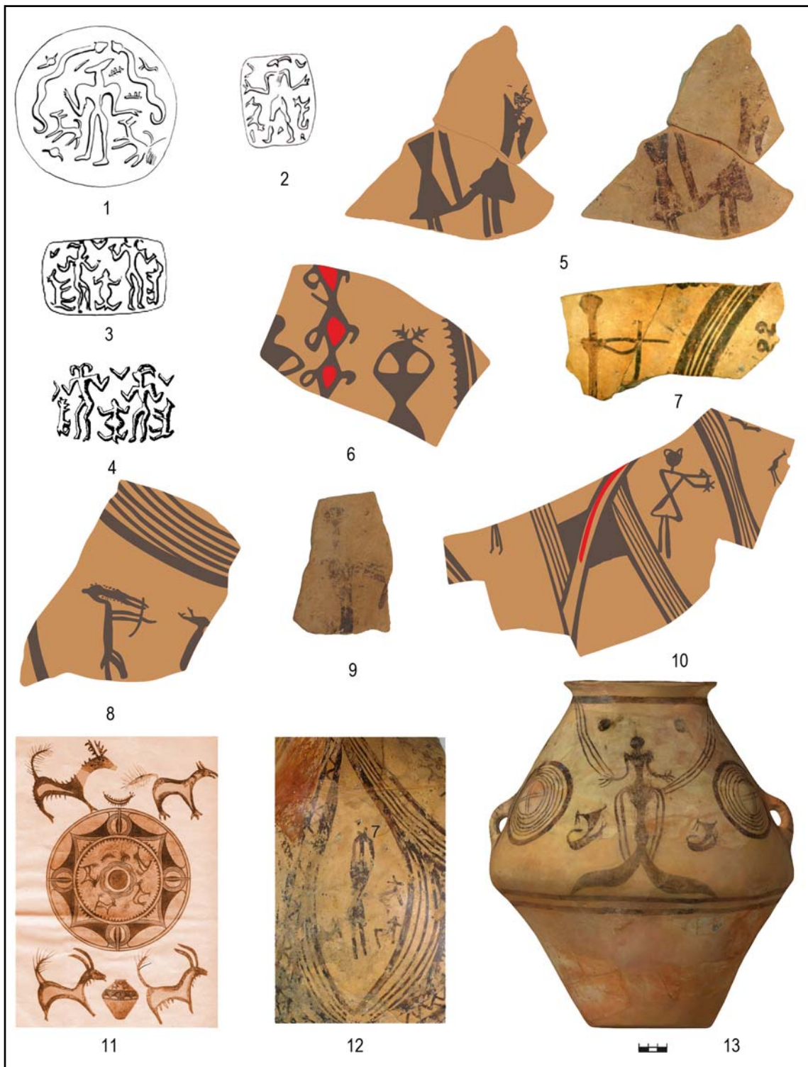
Рис. 3. Изображения рогатых демонов на энеолитической глиптике Ближнего Востока (1—4) и образы мифических персонажей на расписной керамике культуры Кукутень В-Триполье С1 (5—13): 1—3 — Телль-Асмар; 4 — Норшунтепе; 5, 6, 8, 9 — Брынзень III; 7 — Брынзень XI; 10 — Жванец-Шцовб; 11 — Крутобородынцы; 12 — Костешть II; 13 — София VIII (1—3 — по Amiet 1980; 4 — по Herzfeld 1933; 5a, 9, 12 — фото автора; 5b, 6, 8, 10 — цветные рисунки автора; 7 — по Țerna, Heghea 2017; 11 — по Videjko 2004b; 13—3D изображение Д.А. Топала)