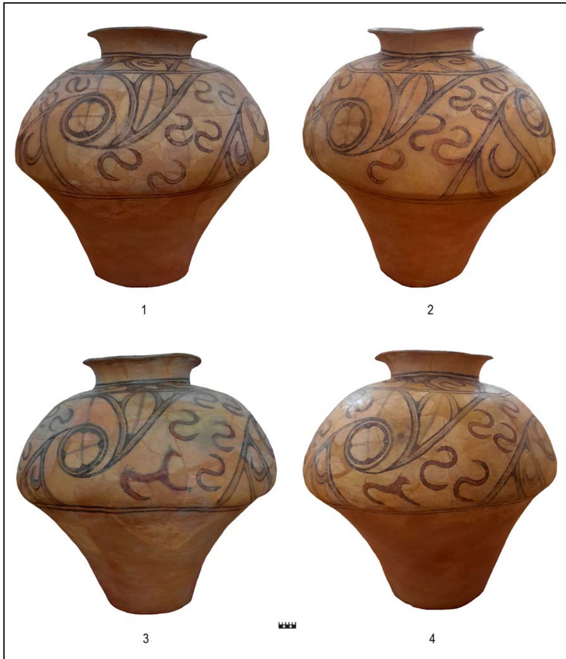
Рис. 7. Расписной сосуд культуры Кукутень В-Триполье С1 с поселения Бадражий Векь.