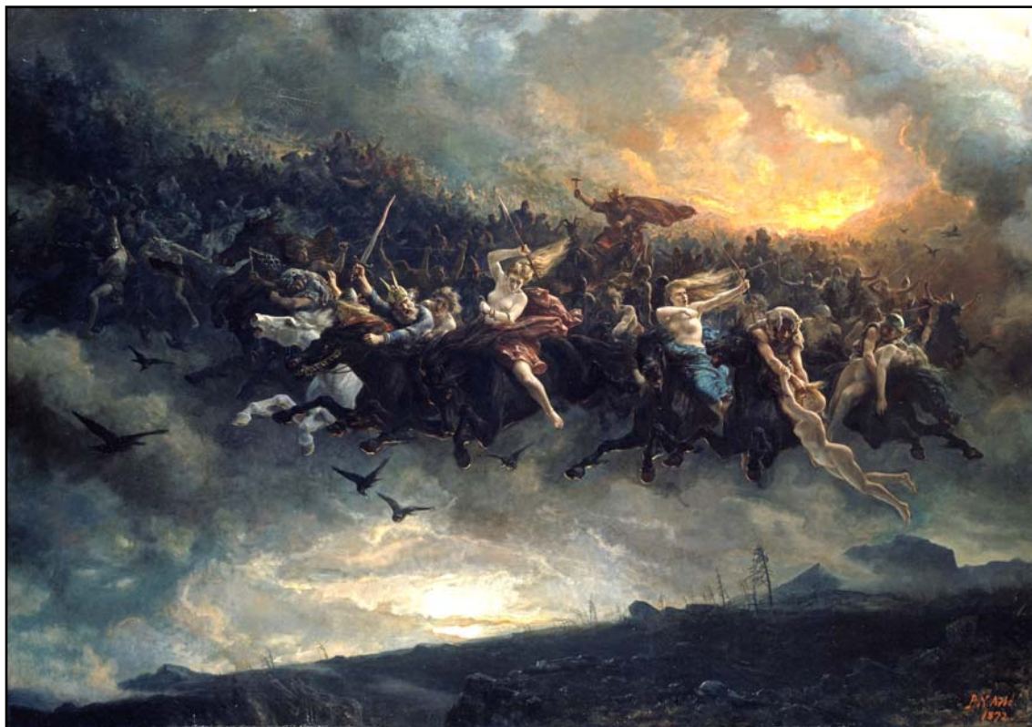
Рис. 2. Петер Николай Арбо, «Дикая охота», 1872 г.