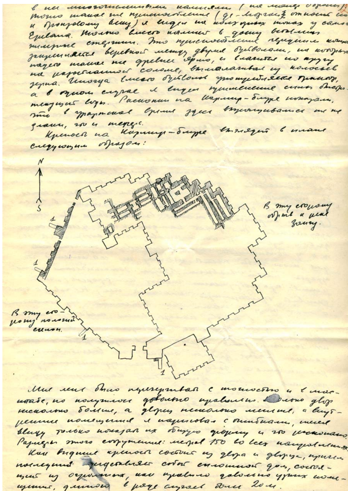
Рис. 3. Страница 3 из письма Всеволода Сорокина, 30 сентября 1947 г.