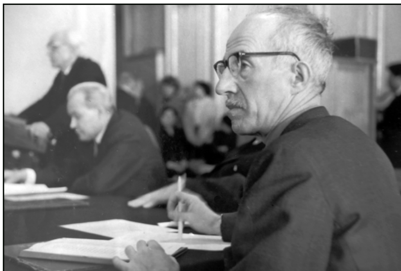
Fig. 6. Vsevolod Sorokin, Leningrad, Leningrad branch of the Institute of Archaeology AS USSR, early 1970s.

говорил, что он написал галиматью и даже не оказался марксистом 71 .