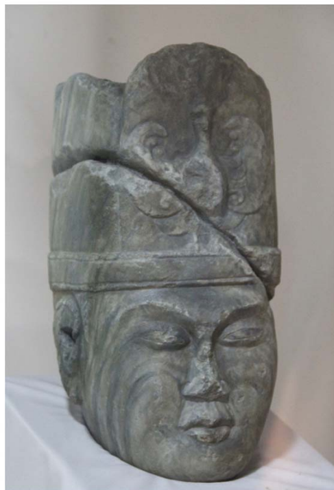
Рис. 1. Катун-Супруга соправителя II Восточно-Тюркского каганата Кюль-тегина.